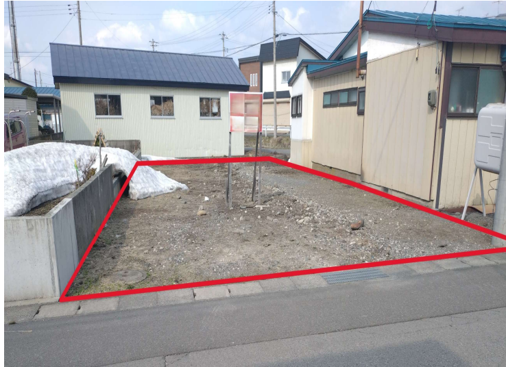
現地外観写真 現地(2026年4月)撮影