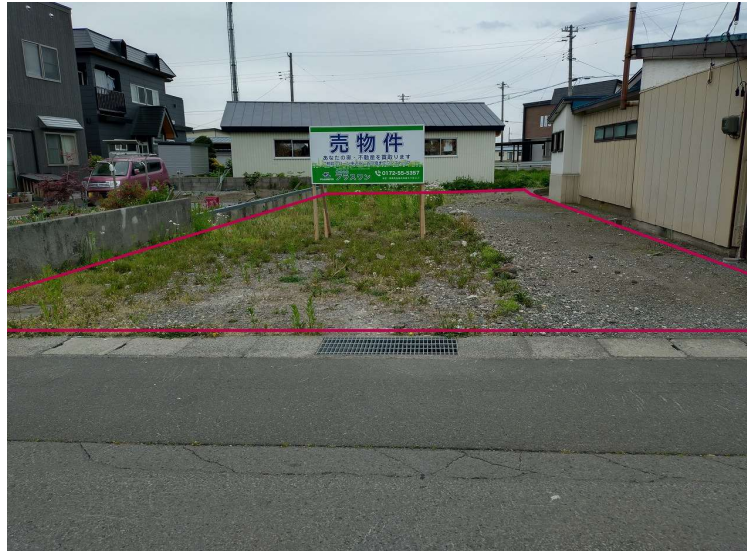
現地外観写真 現地(2026年5月)撮影