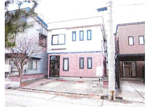
リフォーム前：外観写真