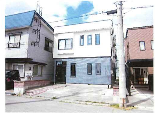
リフォーム後：外観写真