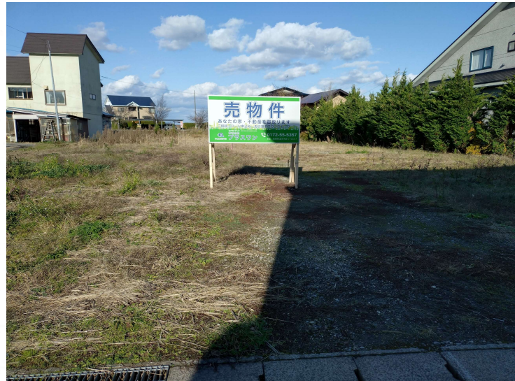
現地写真 現地(2025年11月)撮影