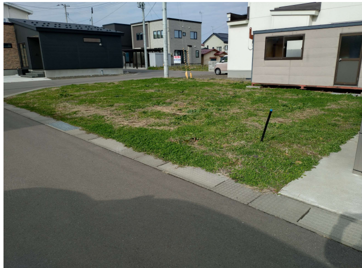
現地外観写真 現地(2025年9月)撮影