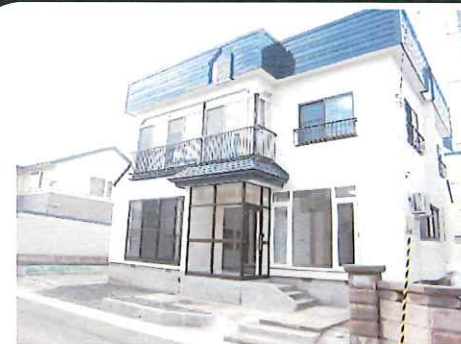
リフォーム後：外観写真