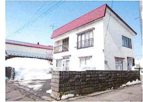
リフォーム前：外観写真