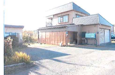
リフォーム前：外観写真