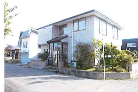
リフォーム前：外観写真