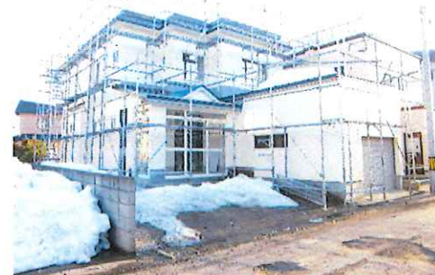
リフォーム後：外観写真