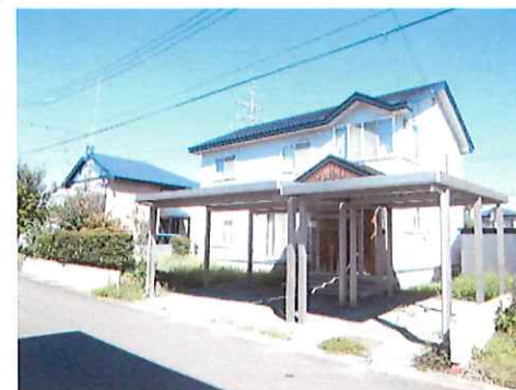
リフォーム前：外観写真