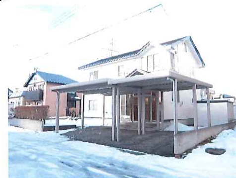
リフォーム後：外観写真