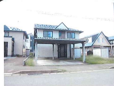
リフォーム前：外観写真