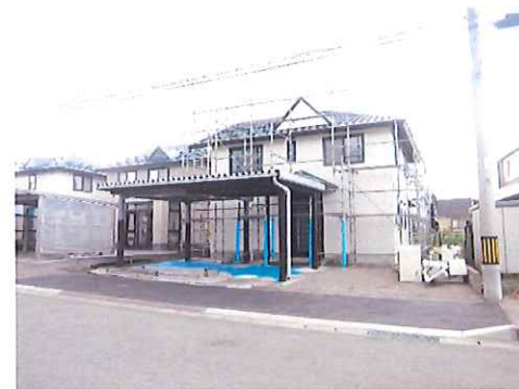
リフォーム中：外観写真