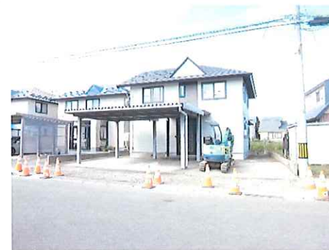
リフォーム中：外観写真