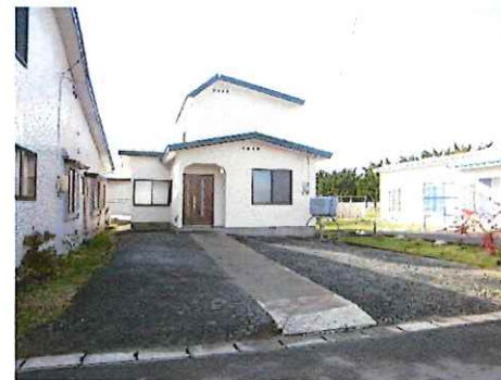
リフォーム後：外観写真