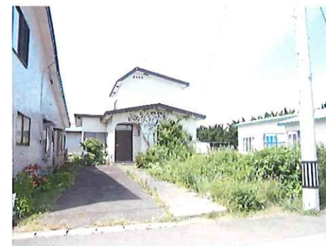
リフォーム前：外観写真