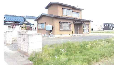
リフォーム前：外観写真