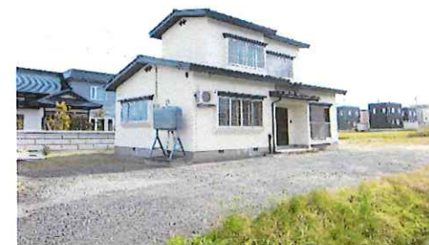
リフォーム後：外観写真