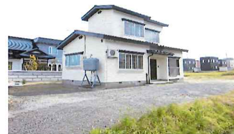
リフォーム後：外観写真