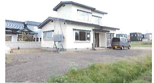
リフォーム中：外観写真