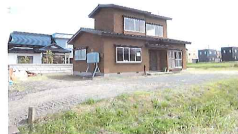
リフォーム中：外観写真