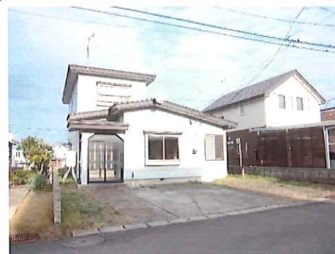
リフォーム前：外観写真