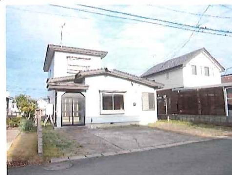
リフォーム前：外観写真