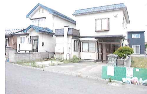
リフォーム前：外観写真