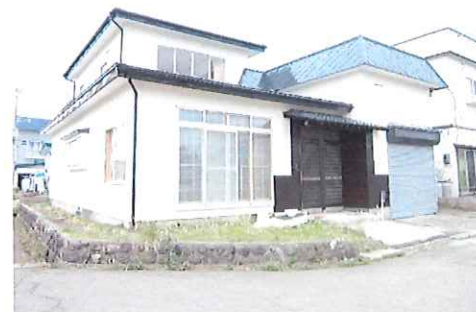
リフォーム中：外観写真